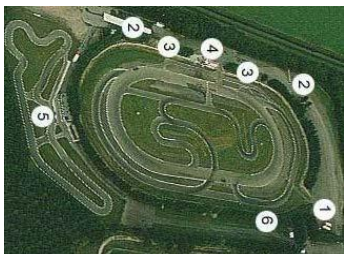
Midland Circuit Lelystad

Een schare fans zou speciaal voor mij komen kijken op het Midland Circuit in Lelystad. Dat moet even uitgesteld worden tot later in het seizoen. Hopelijk ben ik op tijd fit voor training op 31 mei en de wedstrijden op 1 juni, op hetzelfde circuit.